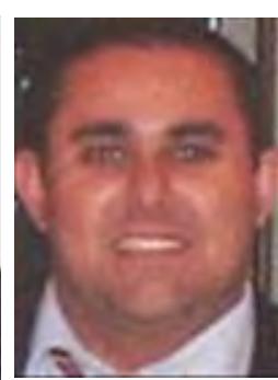
Liborio Palazzo Terre di Aci