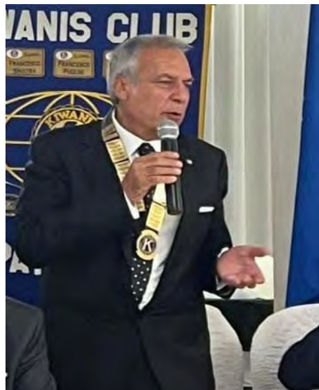
LGT Governatore Angelo Galea