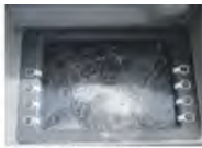
Il postamat danneggiato

pazione, tra i commercianti di Bronte, e non solo, per l'escalation di furti commessi ai loro danni ultimamente. Gli ultimi episodi tra il lunedì e il martedì di Pasqua con due colpi messi a segno in via Messina. La notte tra Pasqua e Pasquetta, ad essere preso di mira è stato un negozio di alimentari. I ladri, si sono introdotti nell'esercizio commerciale da una porta laterale, poco visibile dalla strada. Una volta dentro hanno portato via delle monete lasciate nella cassa per dare il resto, e alcuni prodotti. Probabilmente il colpo non ha causato danni maggiori, perché qualcuno ha avvertito la presenza dei ladri ed ha avvisato il 112. Vistosi scoperti i ladri sono scappati lasciando per strada alcune derrate alimentari tra cui preziose forme di formaggio. Nella fuga, è stato prelevato e portato via anche