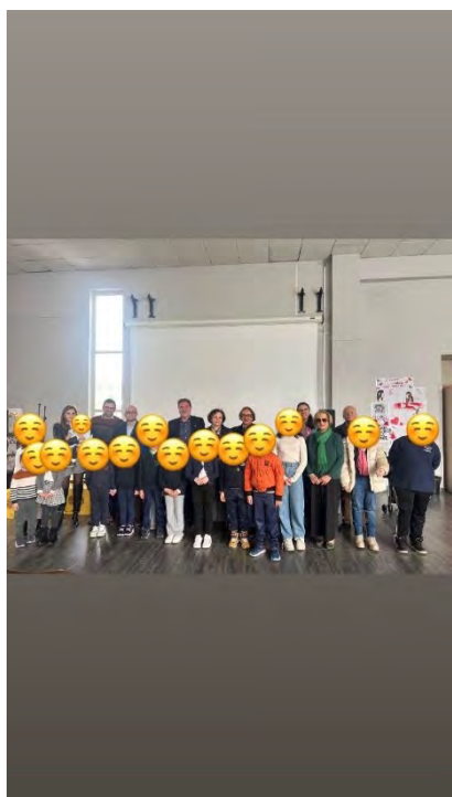
Il Club Kiwanis Paternò