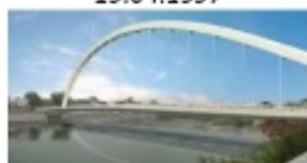
'Ponte Meier sul fiume Tanaro' Alessandria